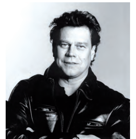
Autor, T. Caspari Schloss Warnsdorf – 12.2013

Aber genau so wie man im Laufe des Lebens den oder besser seinen Geschmack entwickelt, muss man auch reif sein für diese Art der Befreiung.